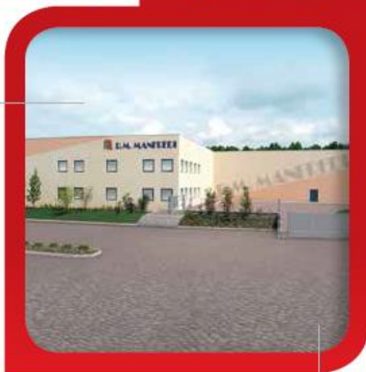
Stabilimento di Romagnano - Logistica