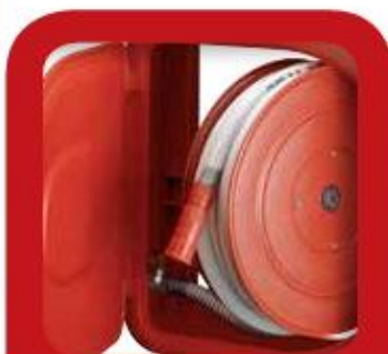
Stabilimento di Valduggia - Produzione